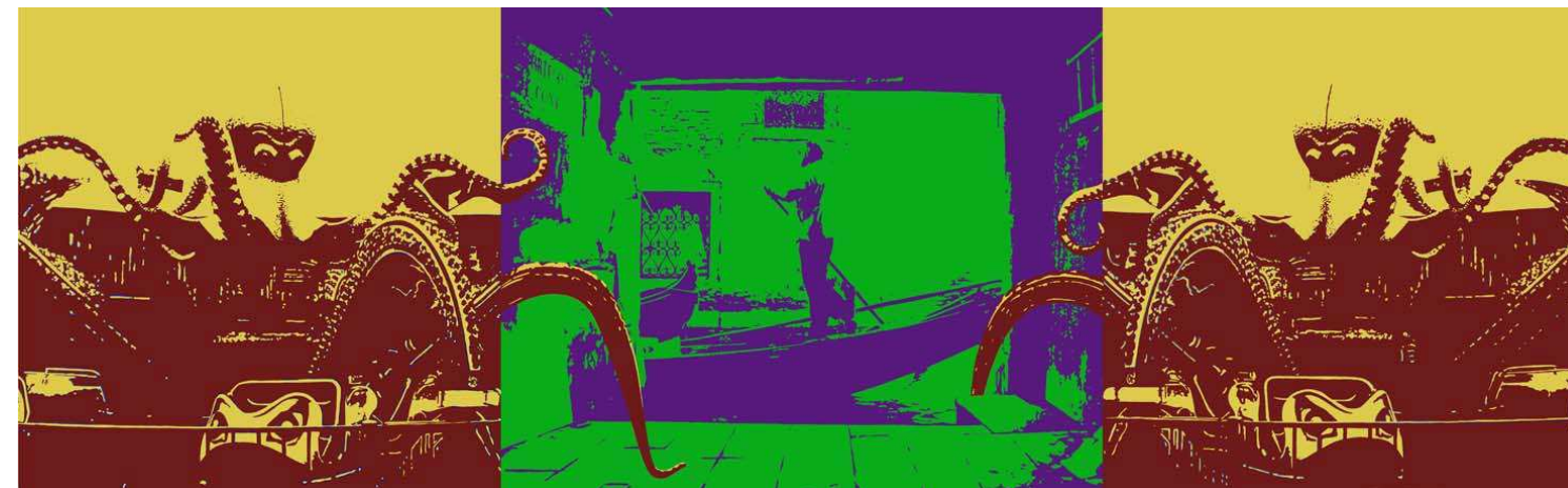
Neptune dans la lagune, 2010, acrylique sur toile 2 x 130 x 130 cm + 130 x 162 cm