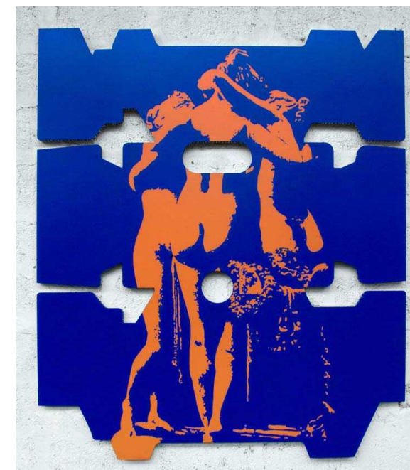
Trois phases de la lune, 2012, acrylique sur aluminium, 148 x 126 x 2 cm