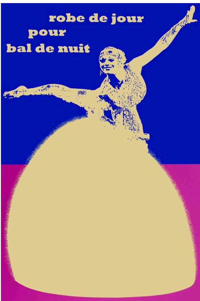
Robe de jour pour bal de nuit, 2010, acrylique sur toile, 146 x 97cm