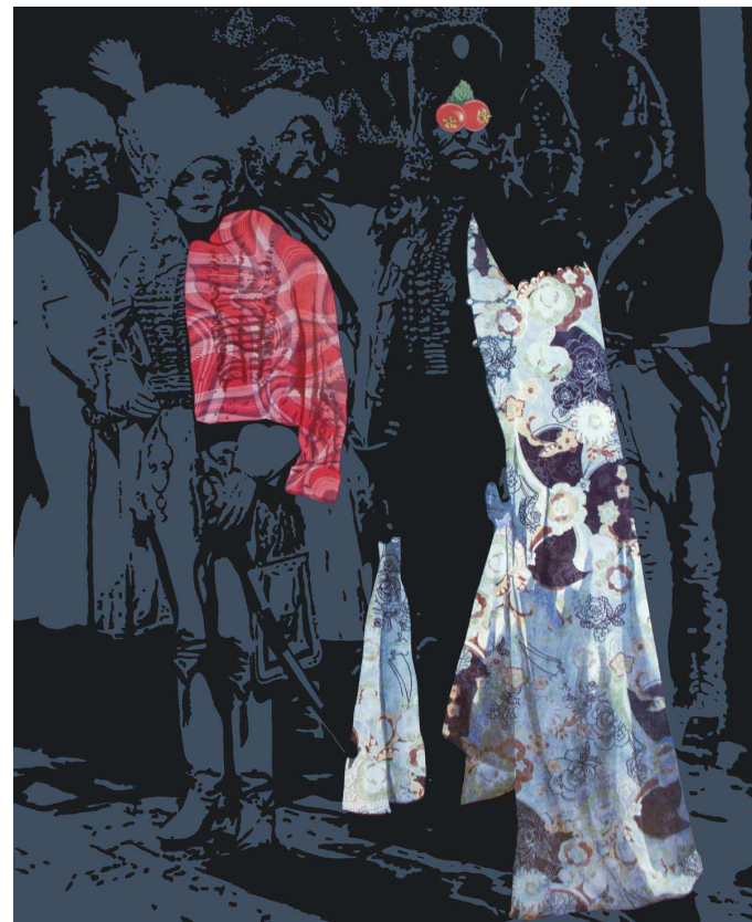
Cherchez la femme , 2007, acrylique sur toile, 162 x 130 cm

Puis des séries à l'esthétique plus immédiate, plus graphique, comme celles des affiches, telles que Dream fabric , C'est dans la boîte ou Paroles d'images . Œuvres dans lesquelles Yvan Messac utilise des matériaux usuels comme le tissu imprimé, le carton, des pochoirs pour enfants. L'utilisation de la couleur est encore plus libre et le jeu entre le texte et l'image opère par glissement de sens et donne la parole aux images à la fois sérieusement et plus légèrement.